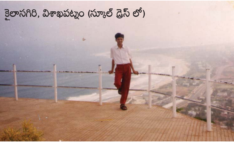
కైలాసగిరి, విశాఖపట్నం (స్కూల్ డ్రెస్ లో)

ఒక రోజు మా టెంట్ క్లాస్ వాళ్ళందరినీ ఎక్స్కుర్షన్ కి టూర్ తీసుకు వెళుతున్నట్టు క్లాసురూంకి సర్కులర్ వచ్చింది. అందరం తెగ