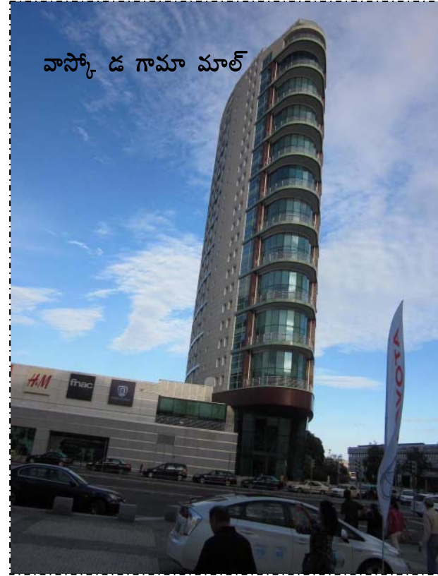
వాస్కో డ గామా మార్కెట్

మా హోటల్లో స్రతీ ఫ్లోర్కి ఓ థీం ఉంది. మాది కిస్. మా ఫ్లోర్ కారిడార్లోని ఓ ఎర్రటి సోఫా మూసిన పెదవుల ఆకారంలో ఉండి, దానిపైన గోడమీద మూడు ఫోటోలున్నాయి. పెదవులు మాత్రమే ఎర్రగా ఉన్న మార్లిన్ మనో బ్లాక్ అండ్ వైట్ ఫోటో, దానికి ఎడమవైపు రెండో ప్రపంచ యుద్ధం ముగిసాక న్యూయార్క్లో టైమ్ స్క్వేర్లో ఓ నర్స్ని ఓ యువకుడు ముద్దు పెట్టుకునే దృశ్యం 'ది కిస్' తాలూకు ప్రపంచ ప్రసిద్ధి చెందిన ఫోటోలో అతని టోపీ మాత్రమే ఎర్రగా ఉంది. మనో