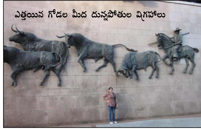
ఎత్తయిన గోడల మీద దున్నపోతుల విగ్రహాలు

”మనం ఉన్నది ప్లాజా ద కోలోన్. అంటే కొలంబస్ స్క్వేర్. కొలంబస్ స్పెనిష్ పేరు క్రిస్టోబాల్ కోలోన్. దీనికి ఈ పేరు రావడానికి కారణం ఇక్కడున్న క్రిస్టఫర్ కొలంబస్ విగ్రహం. కుడివైపు చూస్తే మీకు అది కనిపిస్తుంది. దీన్ని కొలంబస్ కే అంకితం ఇచ్చారు. 56 అడుగుల ఎత్తు పునాది మీద ఓ స్థూపం, దానిమీద స్థంబం, దానిమీద ఇటలీలో తయారైన పదకొండు అడుగుల ఎత్తుగల పాలరాతి క్రిస్టఫర్ కొలంబస్ విగ్రహం ఉన్నాయి. 1864లో క్రిస్టఫర్ కొలంబస్ కో చిహ్నాన్ని నిర్మించాలనే ఆలోచన రెండవ ఇసబెల్లాకి వచ్చింది. కాని 1868లో జరిగిన తిరుగుబాటు వల్ల అది అమలు కాలేదు. 1877లో దీని నిర్మాణ డిజైన్ కి ఫోటీని నిర్వహించారు. అర్బురో మెయిల్లా డిజైన్ గెలుచుకుంది. 1881-1885ల మధ్య దీని నిర్మాణం ఇటలీ జరిగింది. 4-1-1886న దీనికి ప్రారంభోత్సవం జరగాల్సి ఉంది. కాని రాజు మరణం వల్ల అది వాయిదా పడింది. ఓ చేతిలో కేస్టెల్ జండాని పట్టుకున్న ఆ విగ్రహం 1892లో ఇటలీనించి చేరుకుంది. 1976లో దీన్ని