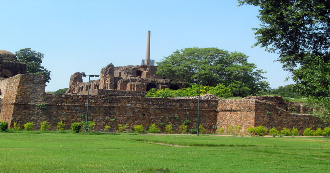
ఢిల్లీ లో ఫిరోజ్ షా కోట్ల వద్ద ఢిల్లీ-తోప్రా అశోక ధర్మ స్తంభం

“మతం, ధర్మం రెండు విధాల వృద్ధి చెందుతుంది. అవి మతాధికారి, ధర్మాధికారుల ద్వారా, మరియు హింసను అంతం చేసి అహింసను ప్రోత్సహించటం ద్వారా.....అసలు అన్ని జీవులకు మరణ దండన నిషేధిస్తే మానవుల యెడల జరిగే హింసను అంతం చేసేటట్లు రాజులు, అధికారులు ప్రవర్తించాలి..... ఇలా జరిగినప్పుడు నా పుత్రులు, వారి పుత్రులు, వారి వారి పుత్రులు సూర్యుడు, చంద్రుడు ఉన్నంతవరకు ప్రజలు ధర్మ మార్గంలో నడుస్తూ సుఖ సంతోషాలతో ఉండగలరు.... రాతి స్తంభాల మీద ఈ నా శాసనం చెక్కించడం వల్ల కలకాలం నా సందేశం ప్రజలకు లభ్యమవుతుంది.”