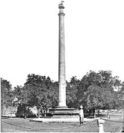
కౌశంబి-అలహాబాదు (ప్రయాగ్ రాజ్) స్థంభం

కొనకమన' (Buddha Konakamana). ఈయనను 'కనకముని' (Kanakamuni) అనేవారు.