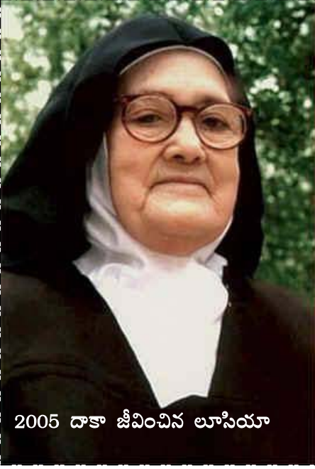
2005 దాకా జీవించిన లూసియా

"ఆధ్యాత్మికంగా రెండు వాదనలు ఉన్నాయి. ఒకటి మనిషికి ఫ్రీ విల్, అంటే ఏదైనా స్వేచ్ఛగా చేసే శక్తి ఉందని. రెండోది ఫ్రీ విల్ లేదని. అంటే మనిషి చేసేదంతా దైవాజ్ఞకి లోబడి చేసేదే రాబోయే యుద్ధం గురించి ఆ దేవత చెప్పిందంటే, రెండో ప్రపంచ యుద్ధాన్ని ఆరంభించిన హిట్లర్ ఏం చేస్తాడో ముందే నిర్ణయించబడిందని భావించవచ్చు. అంటే మనిషికి ఫ్రీ విల్ ఉన్నట్లుగా కనపడ్డా, అది లేదని అర్థమౌతోంది.