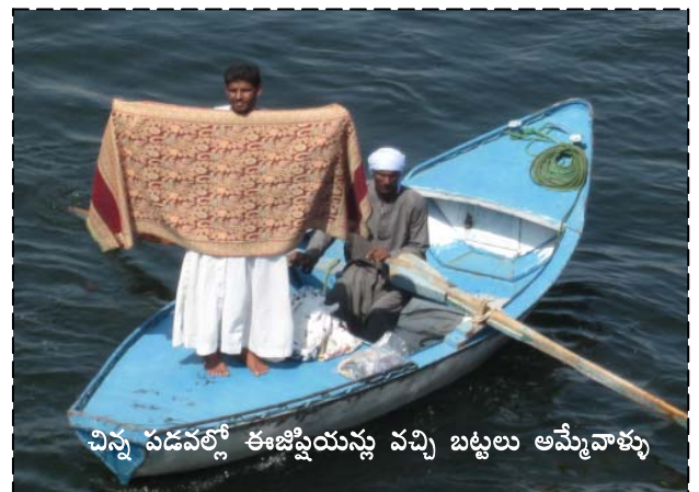
చిన్న పడవల్లో ఈజిప్షియన్లు వచ్చి బట్టలు అమ్మేవాళ్ళు

అకస్మాత్తుగా ఎరుపు - నీలం రంగు చిన్న తెడ్డు పడవల్లో అరబ్బు దుస్తుల్లోని కొందరు బట్టల వ్యాపారస్థులు మా ఓడని సమీపించి, ఆడవాళ్ళ చీరలని చూసి 'ఇండియా! టవల్. లుక్' అని అరిచారు. ఒకడు ఓ టవల్ ని లాఘవంగా నలభై అడుగుల ఎత్తున్న డెక్ మీద పడేలా విసిరి, 'హలో! గుడ్ ఫైన్స్' అని అరిచాడు. పడవల్లోని వాళ్ళు దుప్పట్లని, షాల్స్ ని విప్పతీసి డిజైన్స్ చూపించారు. ఒకటి ఆరువందల ఈజిప్షియన్ పౌండ్స్ అని చెప్పారు. మా గ్రూప్ వాళ్ళకి ఓ యూరోపియన్ బ్రోకెన్ ఇంగ్లీష్ లో ఏబై పౌన్లకి మించి చెల్లించడని చెప్పాడు.