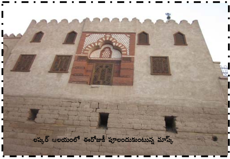
లక్సర్ ఆలయంలో ఈరోజుకీ పూలందుకుంటున్న మాస్క్

ఆ టెంపుల్ ఎంట్రన్స్ ఫీజ్ అరవై పౌన్లు. ఎంట్రన్స్ లో అటు, ఇటు ఎత్తైన ప్రాచీన సేండ్ స్టోన్ ప్రహారీగోడలు, వాటి మధ్య దారికి కుడివైపు 36 అడుగుల ఎత్తున్న గ్రానైట్ రాతిలో చెక్కిన, కూర్చుని ఉన్న రామ్ సేస్ - 2 విగ్రహం, ఎడమవైపు 80 అడుగుల ఎత్తుగల ఒబ్లిస్క్ కింది భాగంలో మొహాలు చేతులు చెక్కేసిన పురుషుల చిన్న విగ్రహాలు నాలుగు ఉన్నాయి. మండుకి వెళ్తే అటు, ఇటు హైరో గ్లిఫిక్స్ చెక్కిన దాదాపు ఇరవై అడుగుల ఎత్తైన స్తంభాలు, వాటి మధ్య నించున్న రామ్ సేస్ - 2 విగ్రహాలు ఉన్నాయి. పైలాన్ గేట్ లోంచి వెళ్తే, రామ్ సేస్ - 2 ఎంట్రన్ కోర్ట్, అది దాటితే పాపిరస్ మొగ్గల ఆకారంలో చెక్కిన అతి భారీ స్తంభాలు కనిపించాయి. ఈ కోర్ట్ లో దక్షిణ భాగంలో