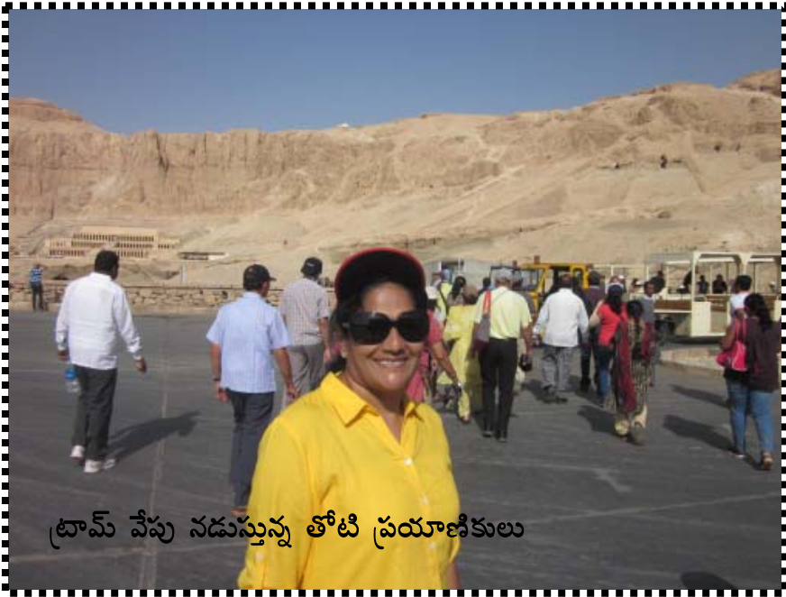
ట్రామ్ వేపు నడుస్తున్న తోటి ప్రయాణికులు

రామ్సేస్ -9 ఎదురుగా మరొకరి సమాధి ఉంది. కానీ దాన్ని మూసేసారు. దానికి కొద్దిగా ఎడమవైపు పైన చెక్కిన మతపరమైన