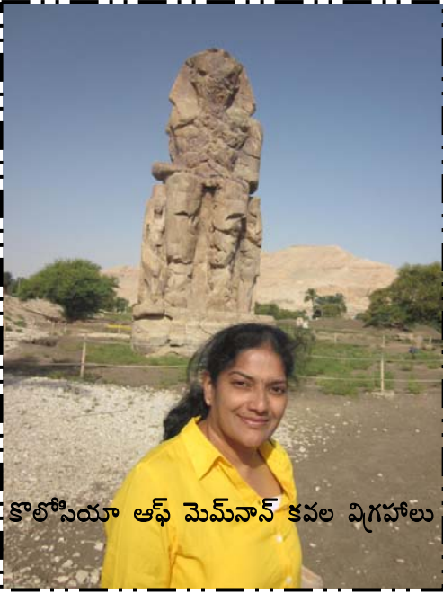
కొలోసియా ఆఫ్ మెమ్నాన్ కవల విగ్రహాలు

కానీ రోమన్స్ క్రీస్తు శకం 3వ శతాబ్దంలో ఆ విగ్రహం నోటిని మూసేసారు. రోమన్ చక్రవర్తి సెప్టిమియస్ సెవెరస్ పగిలిన ఆ విగ్రహానికి మరమ్మత్తులు చేయించాడు. దాంతో ఆ ధ్వనులు ఆగిపోయాయి. ఆధునిక శాస్త్రజ్ఞుల ప్రకారం ఉదయపు సూర్యుడి వేడి కిరణాలు ఆ పగుళ్ళలో పడి, రాత్రి ఏర్పడ్డ తేమని ఆవిరయ్యేలా చేయడంతో, ఆ ఎడారి సన్నటి వైబ్రేషన్స్ కలగడం ద్వారా ఆ ధ్వని తరంగాలు పుట్టేవి.