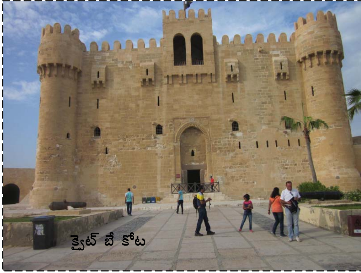
క్వైట్ బే కోట

తాగడం మంచిది కాదు. ఆ హోటల్లో మమ్మల్ని చూసి వండినట్లున్నారు. చాలా ఆలస్యంగా సర్వ్ చేసారు. అన్నం సగమే ఉడికింది.