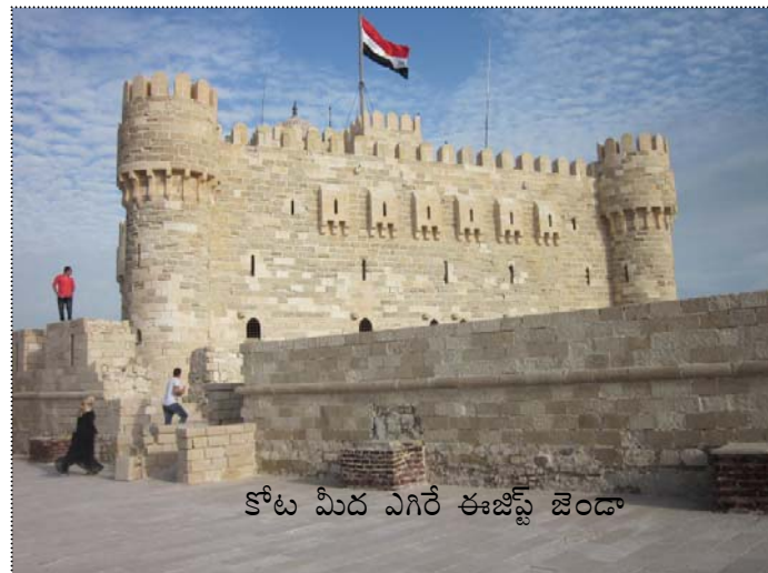
కోట మీద ఎగిరే ఈజిప్ట్ జెండా