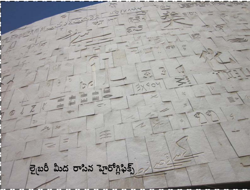
లైబరీ మీద రాసిన హైరోగ్లిఫిక్స్

భాషలనించి పుస్తకాలని అనువదింప చేసాడు. అరిస్టాటిల్ పర్సన్ ల్ లైబరరీని ఇక్కడికి తరలించారని నమ్ముతారు. టోలమీ చక్రవర్తి -3 కి విజ్ఞానం అంటే ఎంతో ఇష్టం. అలెగ్జాండ్రియా ఓడ రేవుకి వచ్చిన ఓడల్లోని పుస్తకాలని ఈ లైబరరీకి ఇవ్వాలని శాసనం చేసాడు. వాటికి కాపీలు తీసుకుని మళ్ళీ తిరిగి ఇచ్చేవారు. ఆయన కాలంలో 50 లక్షల పాపిరస్ స్క్రోల్స్ ఉండేవని అంచనా. ఇది విస్తరించాక, దీనికి అనుబంధంగా మరో గ్రంథాలయాన్ని (డాటర్ లైబరరీ) సెరాపిస్ ఆలయంలో ఏర్పాటు చేసారు. కళలకి చెందిన 9మంది దేవతల్లో ఇది మూసెస్ అనే దేవతకి అంకితం ఇవ్వబడింది. ప్రపంచంలోని అనేకమంది మేధావులు ఇక్కడికి వచ్చి ఆ పుస్తకాలు