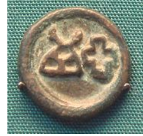
క్రీ.పూ. 200-100 నాటి తక్షశిల నాణెం.

రామాయణకాలం తదుపరి స్థాపించబడి, తరువాత ప్రపంచ ప్రఖ్యాతిగాంచిన తక్షశిల విశ్వవిద్యాలయానికి కేంద్రమైన 'తక్షశిలానగరం' ఈనాడు భారతావనిలో గాక పాకిస్తాన్ అంతర్భాగమైపోయింది. ఇప్పుడు దీని పేరు 'తక్షిల' (Taxila - నీలిరంగు).