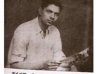
జెవరకాండ బాలగంగాధర తిలక్

తిలక్ అమృతం కురిసిన రాత్రి ఒక పునర్మూల్యాంకనం - అద్దేపల్లి రామమోహనరావు