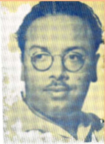
1939 లో బి. ఎన్. రెడ్డి

ఇన్ని సంవత్సరాల కాలంలోనూ బి. ఎన్. విడుదల చేసిన చిత్రాలు అయిదు మాత్రమే—ఆరవది త్వరలో విడుదల కానున్నది. “స్వర్ణసిమ” కరుణాత చాలా ఏళ్లు ఆయన చిత్రమే లేదు. అయినప్పటికీ ఆయన చిత్రం తీయని సమయంలో ఆయన స్థానం వాకిగానే పుండిపోయిందిగాని ఆ స్థానాన్ని మరొకరు ఆక్రమించుకోవడం