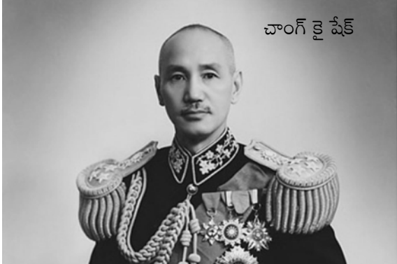
చాంగ్ కై షేక్

ఇదంతా అవకాశవాదమని రాయ్ ఖండించారు. గ్రామాలలో కమ్యూనిస్టులు బలపడి గ్రామ పాలనలు అధీనం చేసుకుని పార్టీ నిలదొక్కుకున్న తరువాత ఉత్తరాది యాత్ర సాగించాలని రాయ్ కోరాడు. రాయ్ పక్షానికి, బరోడిన్ పక్షానికి వ్యతిరేకత ఏర్పడింది. కార్మికులు, కర్షకులు బలపడిన తర్వాత దండయాత్ర సాగించాలని, ఇంతవరకు ఉద్యమాన్ని లోతుపాతులతో బలపరచాలని రాయ్ కోరాడు. ఈ విషయంలో బరోడిన్ కు రాయ్ కు తేడా వచ్చింది. దీనిని క్షుణ్ణంగా పరిశీలించమని 1926 నవంబర్ లో అత్యవసర సమావేశం ఏర్పాటు చేశారు.