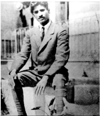
మెక్సికోలో మొదటిసారిగా కమ్యూనిస్టు పార్టీని ప్రారంభిస్తున్నప్పుడు