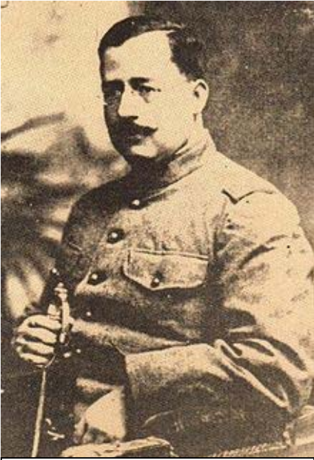
యుకటాన్ గవర్నర్ జనరల్ అల్వరాడ్

అమెరికా నుండి తప్పించుకుని మెక్సికో వచ్చిన రాయ్ దంపతులకు కొత్తగా తెలిసిన వార్త ఏమంటే శాన్ ఫ్రాన్సిస్కోలో విచారణ జరిపి రాయ్ కు కోర్టు శిక్ష విధించింది. ఇండియా నుండి డెన్ హమ్ అనే పోలీసు అధికారి వచ్చి ఫిర్యాదు ఇచ్చి విచారణ జరిపించి శిక్షపడేటట్లు చేశారు. ఈ డెన్ హమ్ అధికారి కలకత్తాలో గుర్రపు స్వారి ప్రాక్టీసుకు వచ్చేవారు. ఎమ్.ఎన్.రాయ్ కూడా అప్పట్లో నరేంద్రనాథ్ గా అదే గుర్రపు స్వారి ప్రాక్టీసుకు వెళ్ళేవాడు. డెన్ హమ్ పోలీసు అధికారిని తెలిసి అక్కడికి వెళ్ళటం మానేశాడు రాయ్. అతనినే అమెరికా పంపించారన్నమాట. అయితే అమెరికాలో విధించిన శిక్ష అమలు జరగలేదు. గనుక చేసేది లేక డెన్ హమ్ మెక్సికో కూడా వచ్చి అక్కడ ఏమీ చేయలేమని తెలుసుకుని వెళ్ళిపోయాడు.