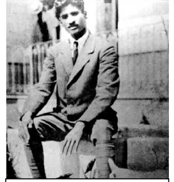
మెక్సికోలో మొదటిసారిగా కమ్యూనిస్టు పార్టీని ప్రారంభిస్తున్నాడు (1917-19)

బరోడిన్ కు విప్లవ చరిత్ర వున్నది. అతన్ని బ్రంట్ విన్ అని, మైకెల్ గ్రూజన్ బర్డ్ అని పిలుస్తారు. లెనిన్ కు మాత్రం బ్రంట్ విన్ అని బాగా తెలుసు. 1905 నుండి రష్యాలో జారు చక్రవర్తుల నిరంకుశ పాలనపై పోరాటం జరిపిన కమ్యూనిస్టులలో లెనిన్ అనుచరుడుగా బరోడిన్ వున్నాడు. దేశం నుండి కమ్యూనిస్టులు ఇరుగుపరుగు దేశాలకు పలు ప్రాంతాలకు పారిపోవలసి వచ్చింది. అలా పారిపోయిన వారిలో బరోడిన్ అమెరికా చేరుకుని అక్కడే పెళ్ళి చేసుకుని ఇద్దరు సంతానాన్ని కన్నాడు. కానీ, లెనిన్ తో కమ్యూనిస్టులతో నిరంతర సంబంధాలు పెట్టుకున్నాడు. అమెరికాలో ఉంటూ కొందరు జర్మనులకు భాషను నేర్పటం మరొకొన్ని సామాజిక కార్యక్రమాలు చేపట్టటంతో కాలం గడిపాడు. ఆ విధంగా రష్యాలో జారు చక్రవర్తులు ఓడిపోయి కమ్యూనిస్టులు అధికారంలోకి వచ్చేవరకూ వున్నారు. ఆ సన్నివేశంలోనే మెక్సికోలో తొలిసారి సోషలిస్టు పార్టీని రాయ్ స్థాపించడం, లెనిన్ కబురుతో మెక్సికో రావడం జరిగింది. బరోడిన్ బహుభాషావేత్త అని, కమ్యూనిస్టు సిద్ధాంతాన్ని బాగా అవగాహన చేసుకున్నవాడని రాయ్ గ్రహించాడు. సిద్ధాంత రీత్యా కమ్యూనిస్టు మౌలిక విషయాలు, గతితార్కిక భౌతిక వాదం రాయ్ కు వివరించి క్రమేణ అతన్ని కమ్యూనిజం వైపుకు తిప్పగలిగారు. సోషలిస్టు పార్టీని మెక్సికోలో స్థాపించి నందుకు అభినందిస్తూ దానిని కమ్యూనిస్టు పార్టీగా మార్చమని సలహా ఇచ్చాడు. రాయ్ అందుకు సుముఖత వ్యక్తం చేశాడు.