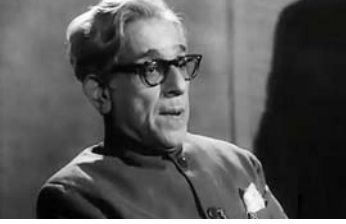
వీరేంద్రనాథ్ ఛటోపాధ్యాయ (1880 – 1937, Moscow) (కవయిత్రి సరోజినీ నాయుడు సోదరుడు)