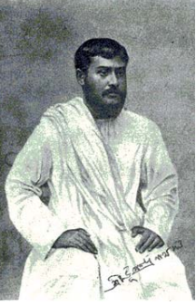
భూపేంద్రనాథ్ దత్త (1880 – 1961)