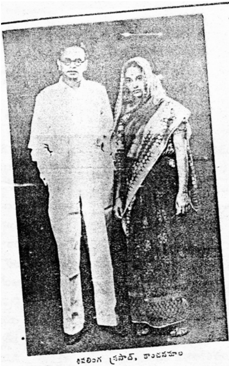
కనలింగ్ క్రసాద్, కాంచనమాల

(తెలుగు సినిమా 1948, ఏప్రిల్ సంచిక నుంచి)